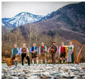
Alpenlandler Musikanten Skolka