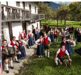
Schuhplattlergruppe D'Sonnwendler Münster