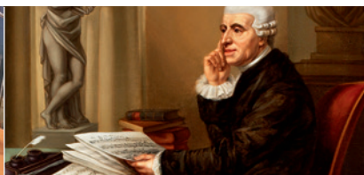
Haydn goes Montreux 2.0