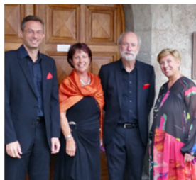
Quatuor du Temps